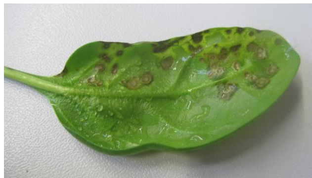
Abb. 2+3: Pseudomonas -Blattflecken an 'Piano F1' (Vol).