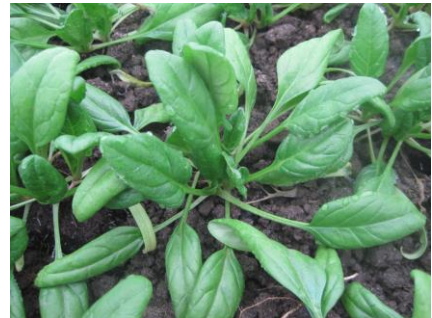
Abb. 10: Sorte 'Mandrill F1' (RZ).