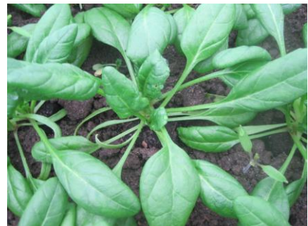
Abb. 13: Sorte 'CR7 F1' (SR).