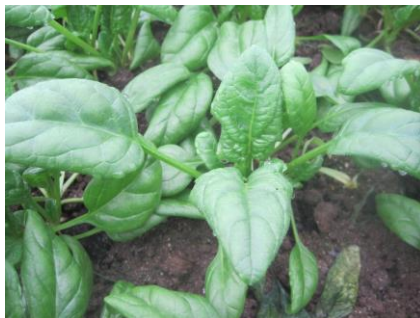
Abb. 12: Sorte 'Platypus F1' (RZ).