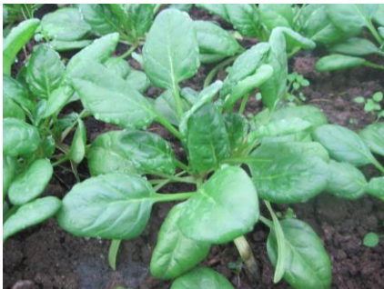
Abb. 8: Sorte 'Ram F1' (EZ).