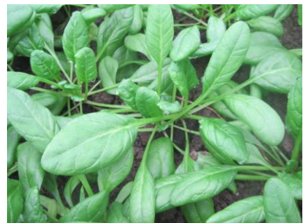
Abb. 16: Sorte 'Violin F1' (Vol).