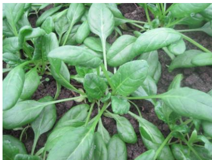
Abb. 15: Sorte 'Piano F1' (Vol).