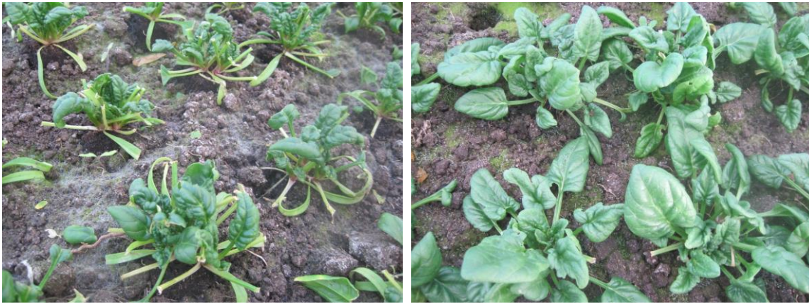
Abb. 6+7: Kümmern und Blattschäden an allen Sorten, vermutlich durch Modernmilben.