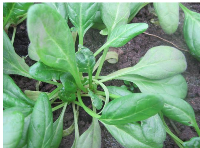
Abb. 4+5: Falscher Mehltau ( Peronospora farinosa f. sp. spinaciae ) an 'CR7 F1' (SR).