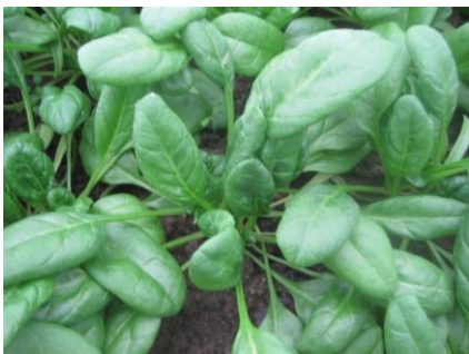
Abb. 11: Sorte 'Meerkat F1' (RZ).