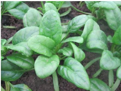
Abb. 14: Sorte 'Imperial F1' (SR).