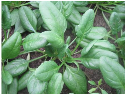
Abb. 9: Sorte 'Shelby F1' (EZ).